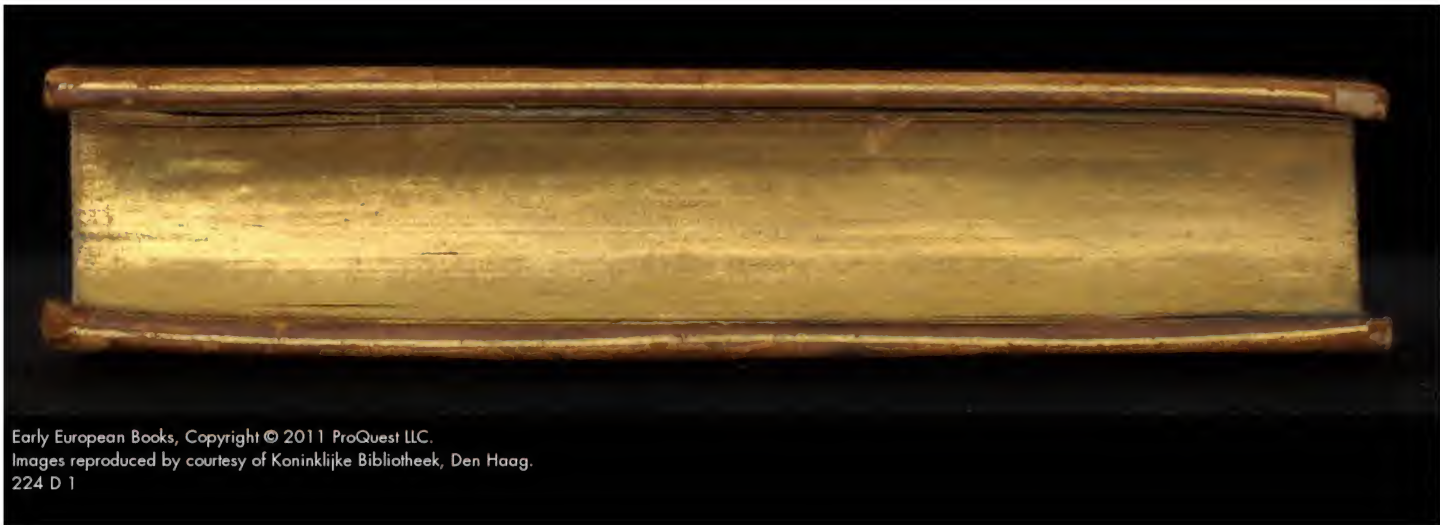
Early European Books, Copyright © 2011 ProQuest LLC. Images reproduced by courtesy of Koninklijke Bibliotheek, Den Haag. 224 D 1